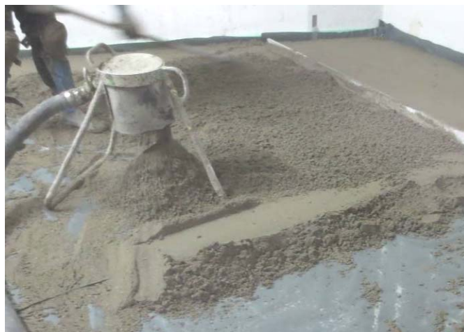
Abbildung A 2.2: Montagesituation mit Zementestrich