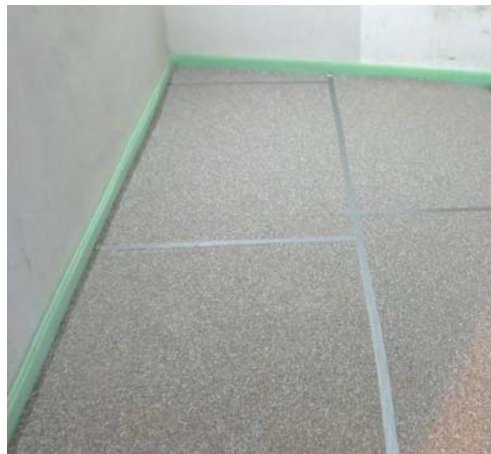
Abbildung A 2.1: Montagesituation mit Trittschalldämmmatten und Randdämmstreifen, Stöße mit Klebeband