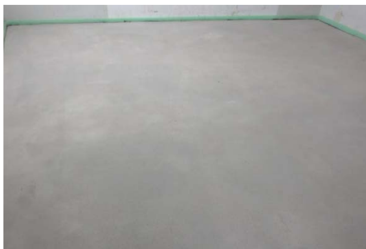
Abbildung A 2.3: Zementestrich (Prüfsituation)